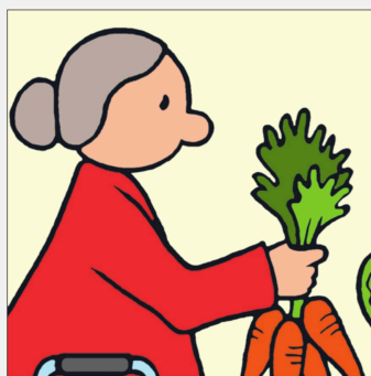
Bildausschnitt 1 zu Lily.