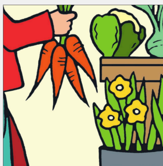
Bildausschnitt 2 zu Lily.